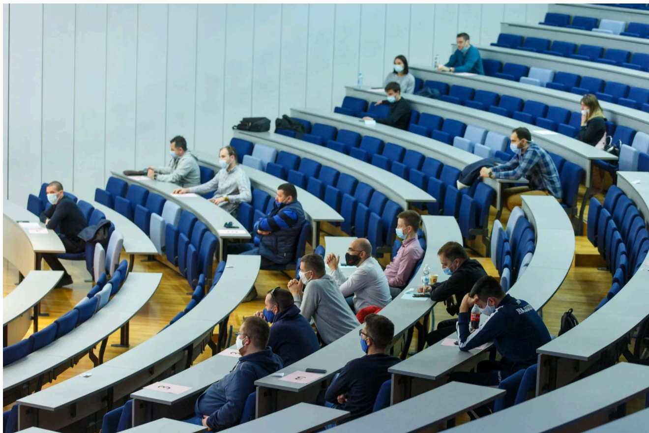
Na brojnim fakultetima u Splitu broj studenata znatno se smanjio u pet godina

Što tek reći za trendove tijekom desetogodišnjeg razdoblja? Deset godina ranije, 2013./2014. godine na našim je visokim učilištima bilo upisano 161.911 studenata, što znači da je do prošle godine njihov broj pao za 13.528 ili za više od osam posto! To je posebno zabrinjavajuće u kontekstu neprestanog bujanja studijskih programa u istom razdoblju te upisnih kvota u prvu godinu studija, koje su samo za iduću 2025./2026. akademsku godinu utvrđene u više nego enormnih 41.384 upisna mjesta (a svih maturanata koji ove godine završavaju srednju školu nema ni 30.000).