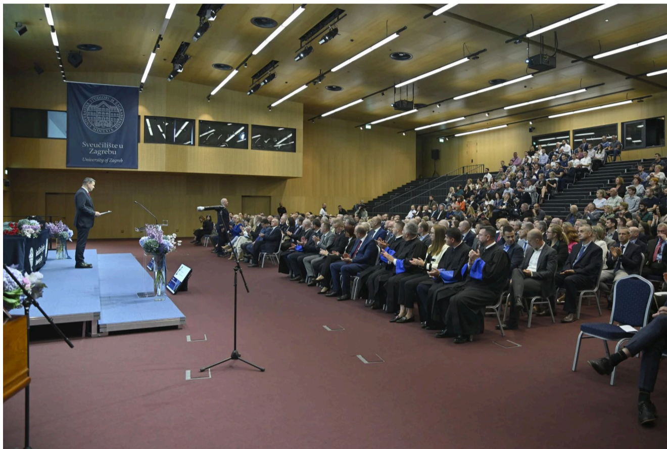
Broj učenika i studenata u Hrvatskoj sve je manji, a kvote za upise na fakultete i dalje bujaju

Ali, spomenimo i to, u istom razdoblju neki splitski fakulteti bilježe veći interes studenata, odnosno raste broj studenata na njima – poput Medicinskog, Fakulteta građevinarstva, arhitekture i geodezije, Sveučilišnog odjela zdravstvenih studija, Sveučilišnog odjela za forenzične znanosti, Filozofskog fakulteta te standardno – Ekonomskog fakulteta.